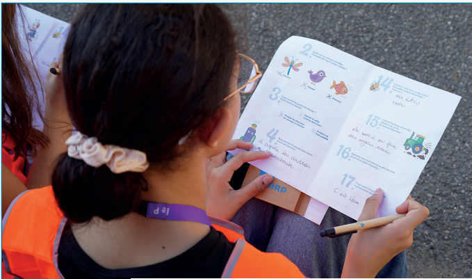
Conception d'un livret jeux pour les plus jeunes pour la visite des stations d'épuration - Les Enfants et Journées du patrimoine - Septembre 2025

Le dernier exemple en date concerne notre projet de film d'animation autour du fonctionnement d'une station d'épuration et le traitement des eaux usées. Tout ce que j'avais pressenti a été bien respecté, avec une validation des directions, pour la technicité et l'esthétisme : nous aurons un contenu accessible aux enfants et un « rendu » dans l'air du temps. C'est très motivant.