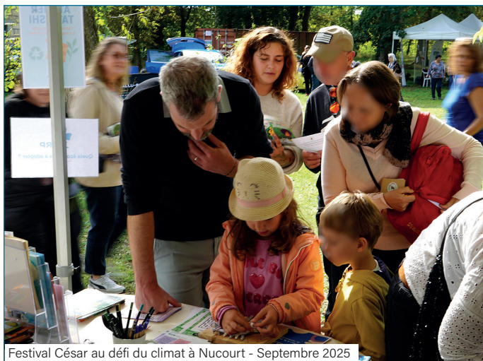
Festival César au défi du climat à Nucourt - Septembre 2025