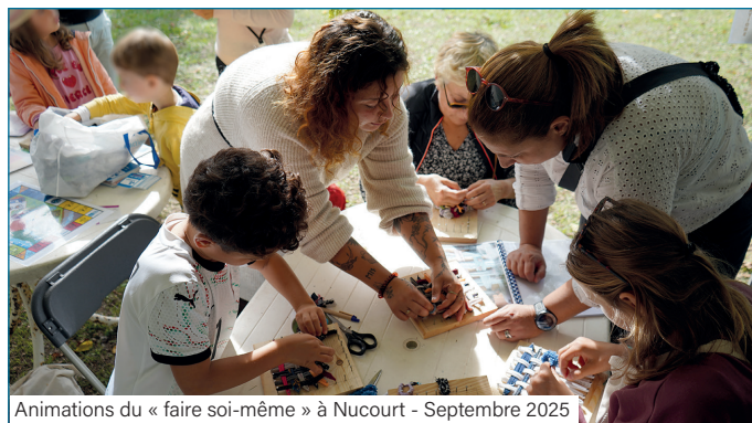
Animations du « faire soi-même » à Nucourt - Septembre 2025

aux animations du « faire soi-même » qui permettent, là encore, de parler des lingettes à ne surtout pas jeter dans les toilettes.