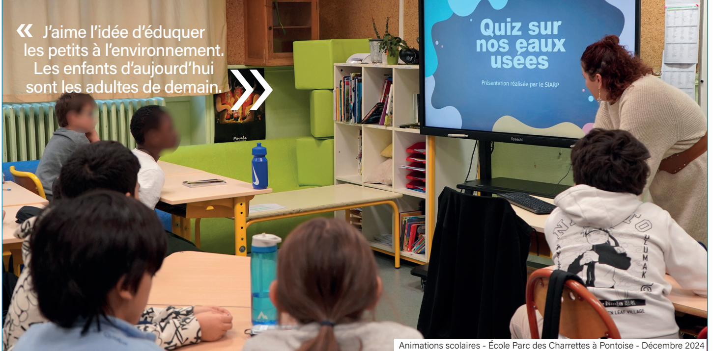
Animations scolaires - École Parc des Charrettes à Pontoise - Décembre 2024

« J'aime l'idée d'éduquer les petits à l'environnement. Les enfants d'aujourd'hui sont les adultes de demain. »