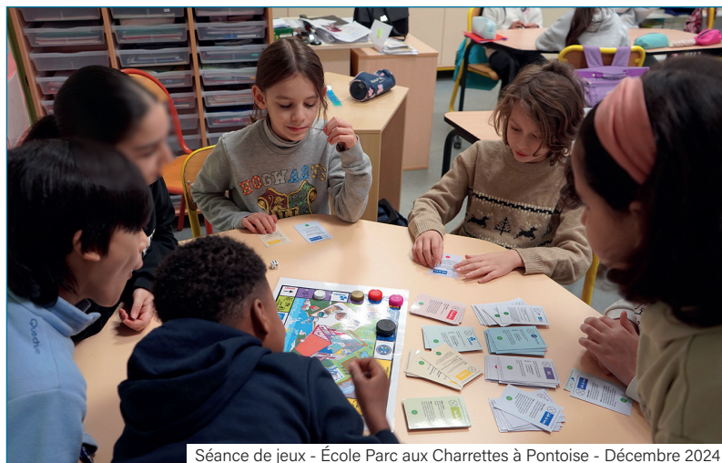
Séance de jeux - École Parc aux Charrettes à Pontoise - Décembre 2024

« J'apprécie vraiment d'être avec les enfants au quotidien, car aucune de mes journées ne se ressemble. »