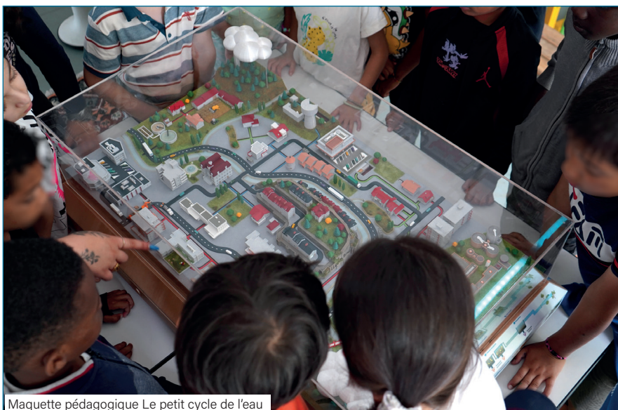
Maquette pédagogique Le petit cycle de l'eau

Mon champ d'action s'est élargi au fil des mois, puisque le SIARP intervient possiblement aussi dans les universités,